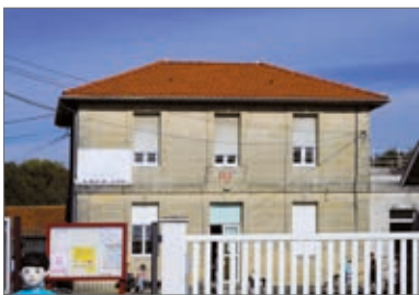
la toiture d'un bâtiment de l'école