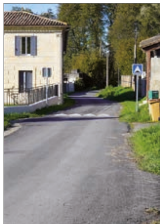
réfection de la chaussée à Gaudry et à Bonnecaze