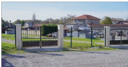
la nouvelle entrée du cimetière