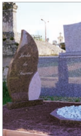
le jardin du souvenir