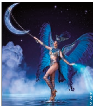
Infinity - L'Ange bleu

Hélène Lanthier 07 70 00 55 38 / Chantal Hervier 06 26 81 63 52