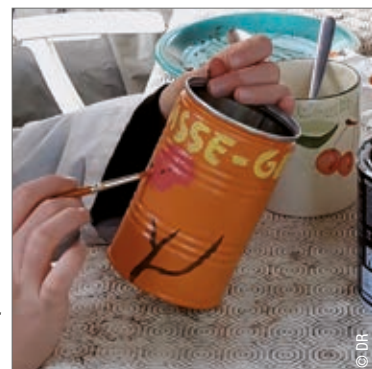
Fabrication et décoration d'une mangeoire à oiseaux